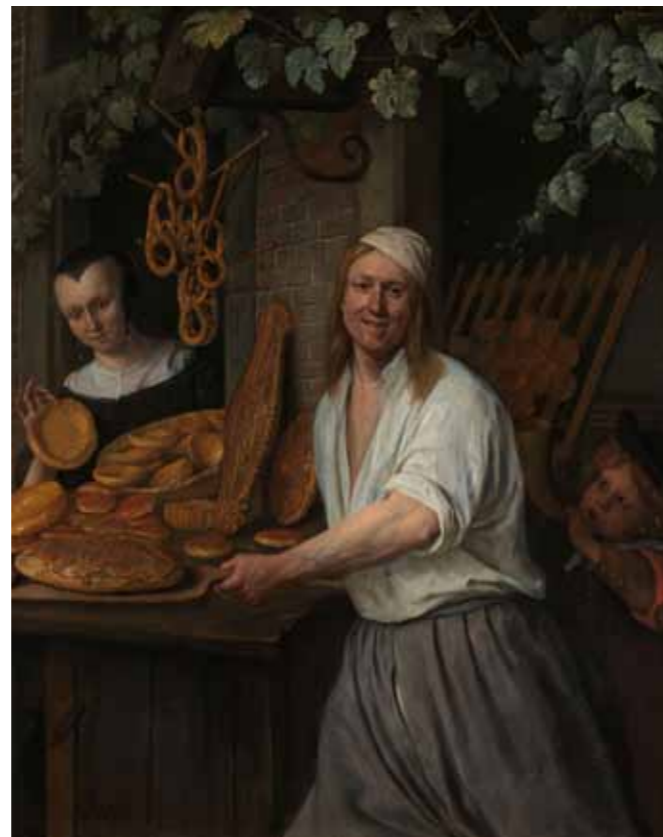
↑ Jan Steen schilderde in 1645 een Leidse bakker met zijn waren. Op dit schilderij is de duivekater afgebeeld: het grote brood dat rechtop tegen de muur staat

Het Zeeuwse kerstfeest bestaat vaak uit een kerkbezoek, uitgebreid eten en drinken, en kerstliedjes zingen bij de kerstboom. Maar de kerstboom is waarschijnlijk een oud Germaans gebruik, komt oorspronkelijk uit Duitsland en kwam pas begin negentiende eeuw naar Nederland. Protestanten voegden hem vervolgens als eerste toe aan hun viering. De altijd groene takken zagen zij als symbool