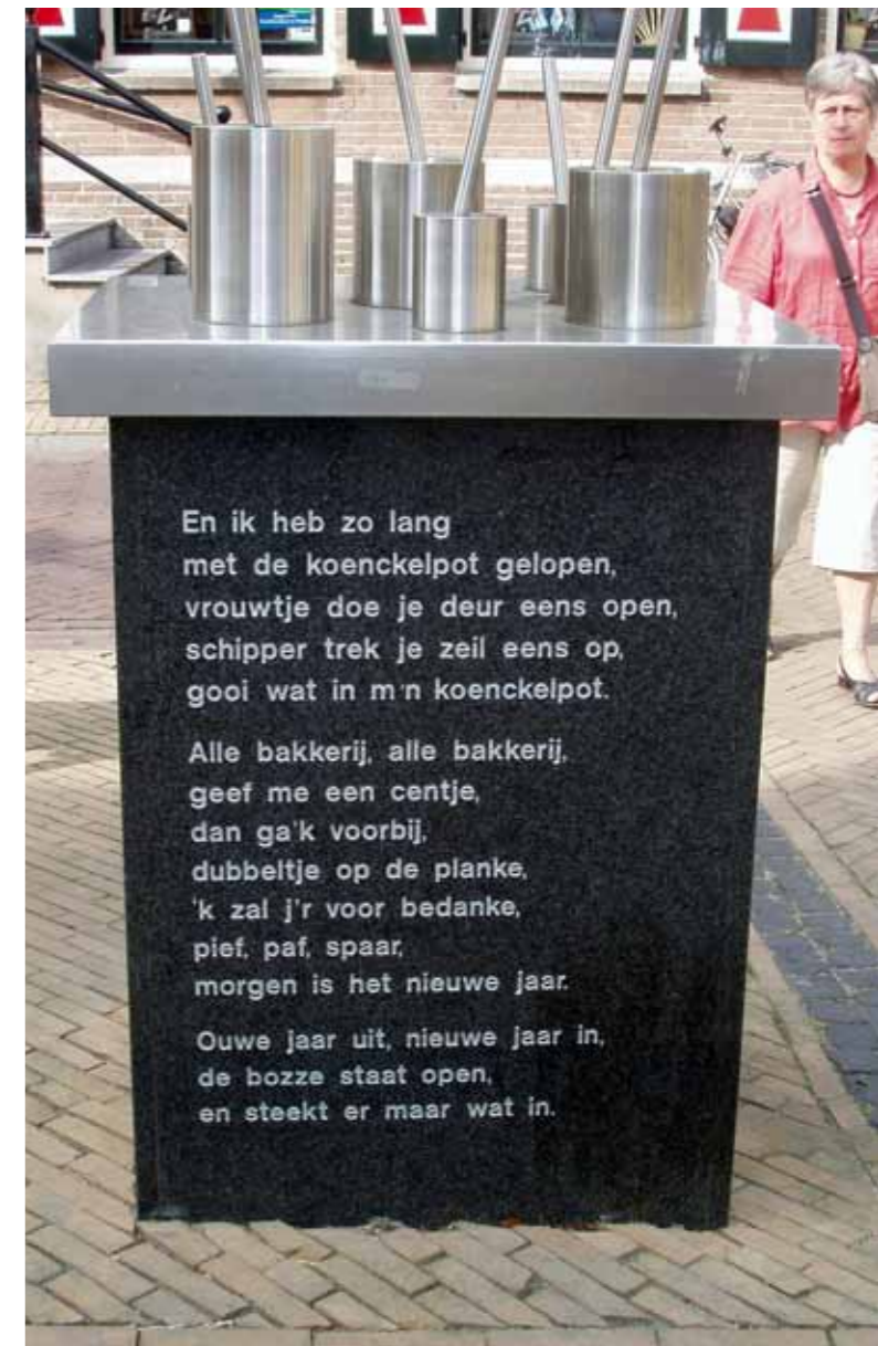
↑ Monument van de koenkelpot in Yerseke

Ook Zeeuwse stranden zijn op 1 januari het decor van de traditionele nieuwjaarsduik. Wederom een gebruik van buitenlandse oorsprong: in het Canadese Vancouver wordt al sinds 1920 een nieuwjaarsduik georganiseerd.