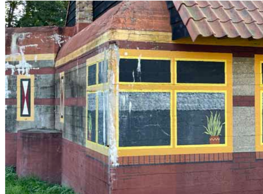
← Bunker met opnieuw aangebrachte schilderingen aan de Vlissingeweg te Middelburg

en kreeg het vliegveld Haamstede een belangrijke militaire functie voor de verdediging van Rotterdam, Zeeland en de luchtkonvoien voor Duitse schepen. Ook werd weer een hele reeks bunkers aangelegd om het vliegveld te verdedigen.