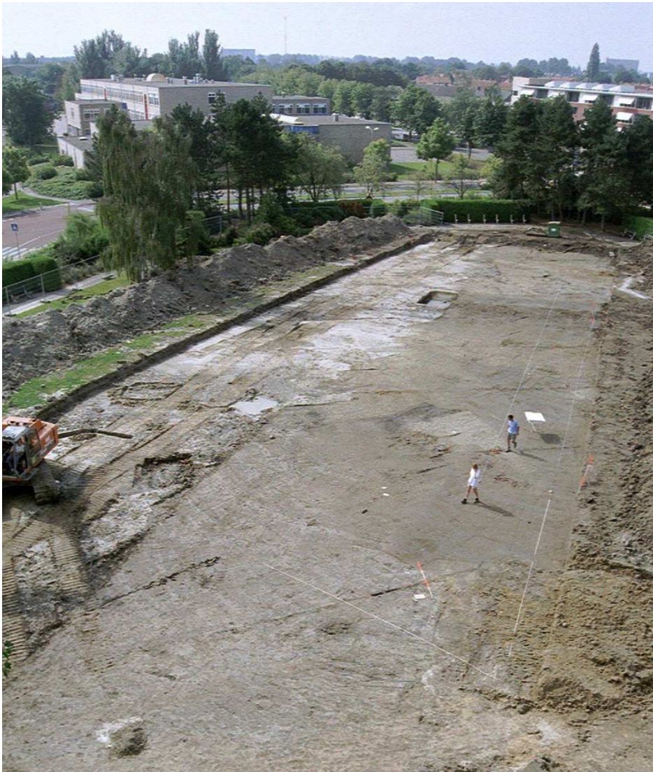
Afbeelding 1 Overzicht put, opgraving Verpleeghuis Ter Valcke in 2002, kijkend naar het zuidwesten.

Het gemeentearchief van Goes inventariseert het cultureel erfgoed in de stad Goes en omliggende dorpen waarbij naast gebouwen ook elementen als gevelstenen, stoepalen, hekken, levensbomen, muurankers ed. op de foto worden gezet en nauwgezet beschreven. Deze inventarisatie heeft als doel het cultureel erfgoed in de gemeente Goes te beschermen en te behouden. In de Cultuurnota 2008-2011 (december 2008) wordt met betrekking tot het cultureel erfgoed gemeld dat ook monumentenzorg, archeologie en het gemeentelijk archief feitelijk onder cultureel erfgoed vallen, maar dat deze vanwege hun specifieke karakter in de nota buiten beschouwing worden gelaten. Voor genoemde beleidsterreinen zijn aparte beleidsnotities in