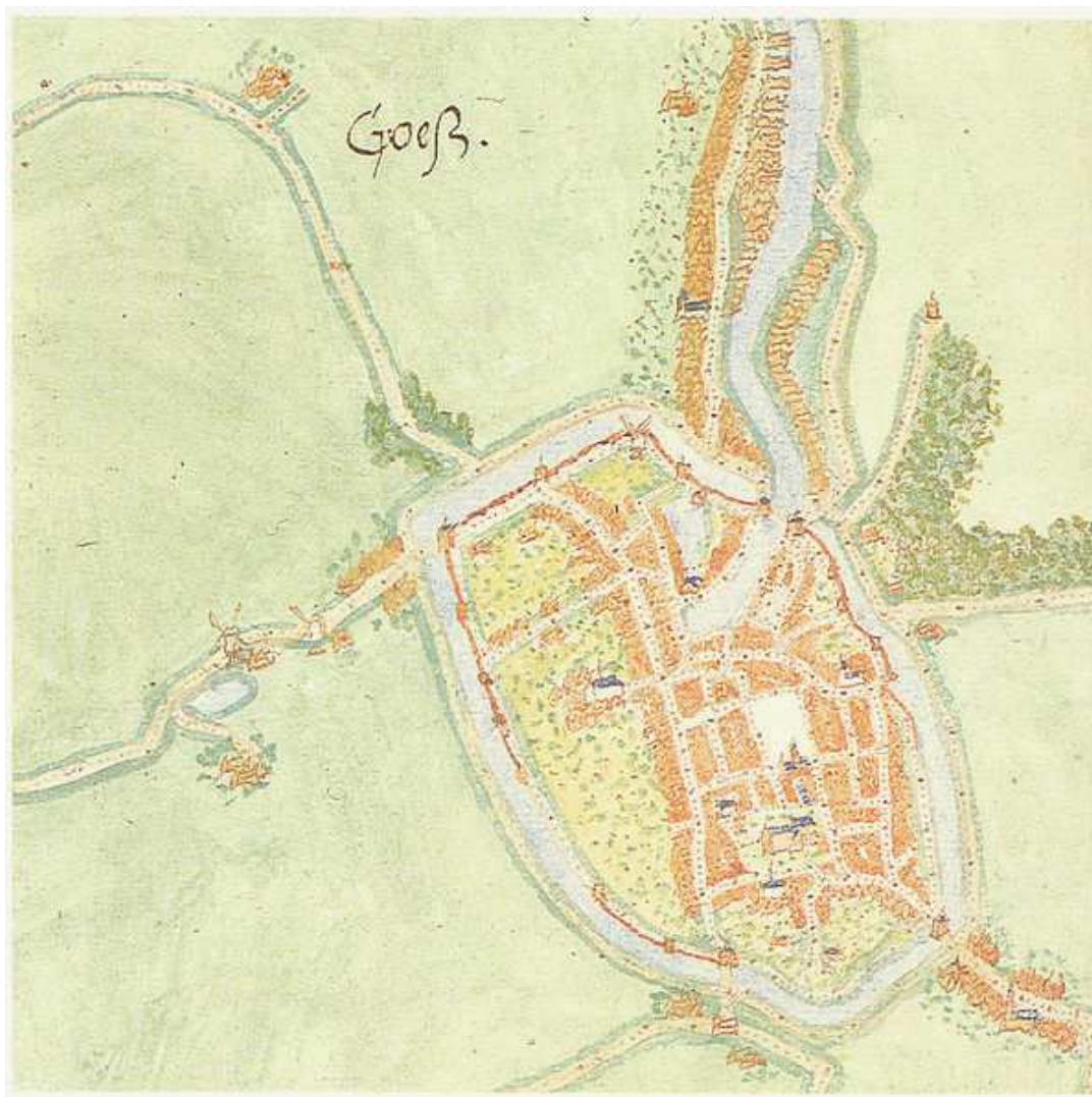
Afbeelding 2 Goes naar Jacob van Deventer (1575).

Voor een algemene introductie op de archeologiebeoefening in Zeeland, als achtergrond voor de archeologische monumentenzorg en het recente onderzoek, kan worden verwezen naar het rapport Archeologie naar deltagoogte uit 2008. 34 Op basis van dit rapport heeft de provincie Zeeland in augustus 2009 haar onderzoeksprioriteiten 2009-2012 vastgesteld. 35 Ook de eerste twee hoofdstukken in het boek Het verhaal van Zeeland zijn mede gebaseerd op resultaten van archeologisch onderzoek. 36 Naast de meer specialistische literatuur die in deel B is opgenomen kunnen als specifieke introductie op de (archeologische) geschiedenis van de gemeente de boeken van C. Dekker over de Bevelanden en de stad Goes worden genoemd ( afbeelding 2 ). 37