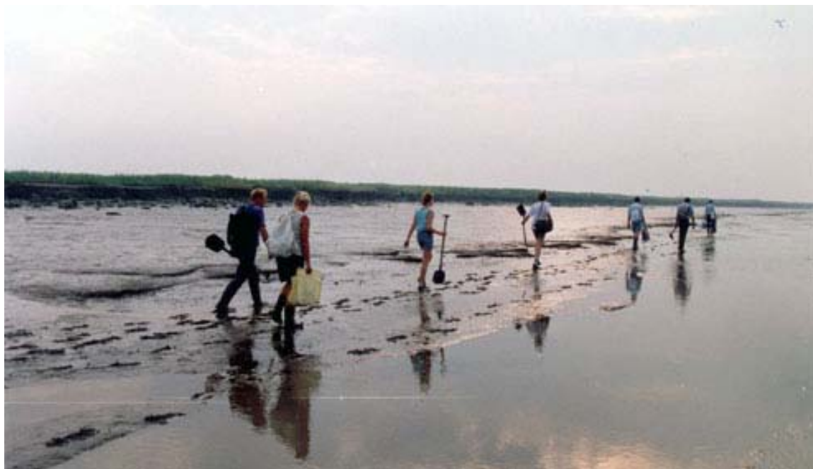
Afbeelding 1 Onderzoek door de AWM afdeling Zeeland van het in 1682 verdrinken dorp Valkenisse (nu wettelijk beschermd rijksmonument).

Hoewel archeologie, ofwel de zorg voor het ondergronds bodemarchief, op dit moment vooral praktisch in relatie tot vergunningen aan de orde komt, is duidelijk dat in Reimerswaal draagvlak bestaat voor zaken als behoud en versterking van de cultuurhistorische erfenis (zowel boven- als ondergronds). De wettelijke zorgplicht voor het bodemarchief kan in het bestaande beleid dus naadloos worden ingepast. In het volgende hoofdstuk wordt aangegeven welk ambitieniveau de gemeente Reimerswaal daarbij kiest.