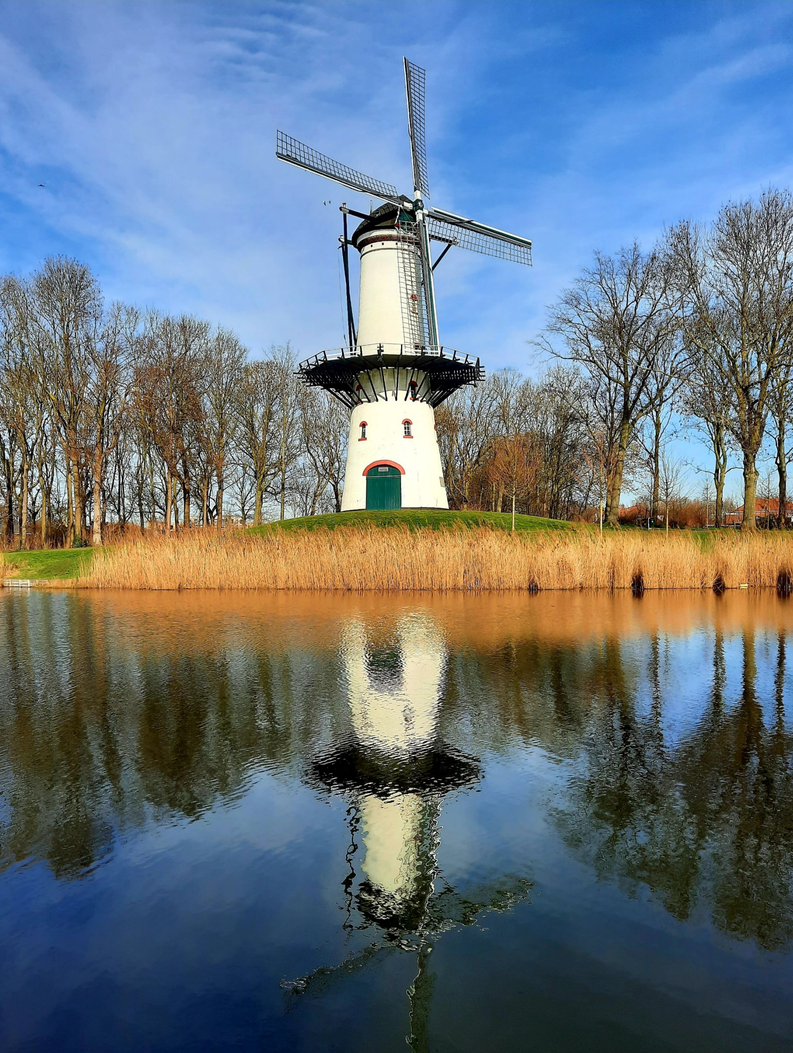
Molen De Hoop in Tholen. De vestingwallen werden tussen 1844 en 1888 grotendeels afgegraven en omgevormd tot plantsoen.