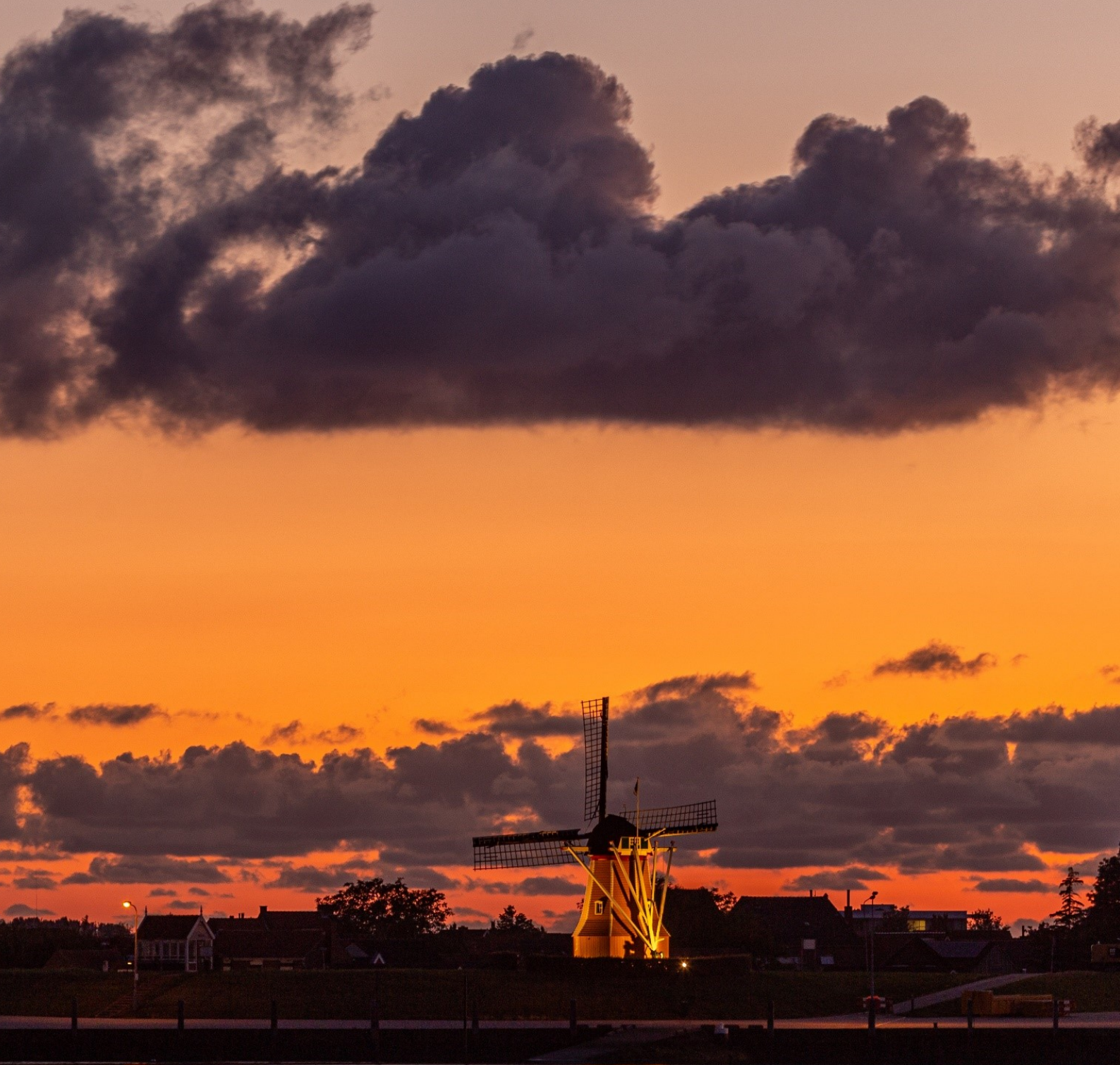
Molen De Hoop in Sint Philipsland met links het praathuisje (ook wel bekend als het leugenkot of 't ouwemannenkotje)

Erfgoed bestaat uit zichtbare en onzichtbare sporen uit ons verleden, die ons herinneren aan waar we vandaan komen en ons bewust maken van onze cultuur en geschiedenis. Er zijn overeenkomsten en verschillen met andere gemeenten. De verzameling van al die overeenkomsten en verschillen vormt onze identiteit ; het maakt ons uniek.