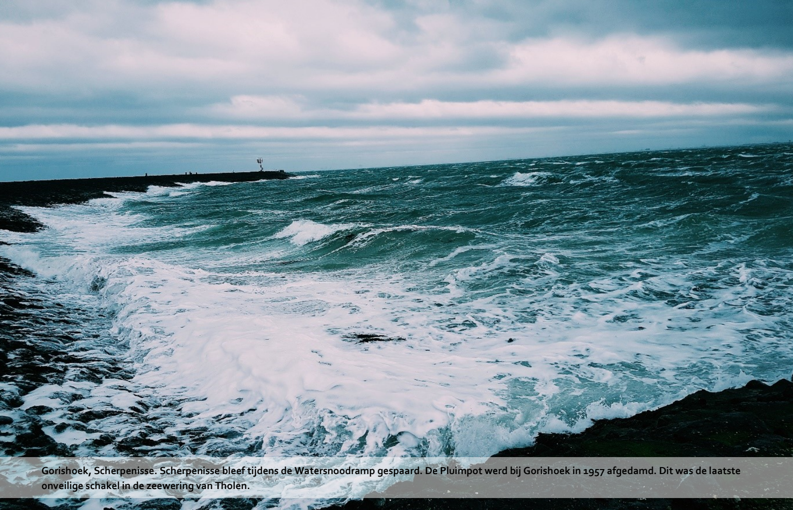
Gorishoek, Scherpenisse. Scherpenisse bleef tijdens de Watersnoodramp gespaard. De Pluimpot werd bij Gorishoek in 1957 afgedamd. Dit was de laatste onveilige schakel in de zeevering van Tholen.