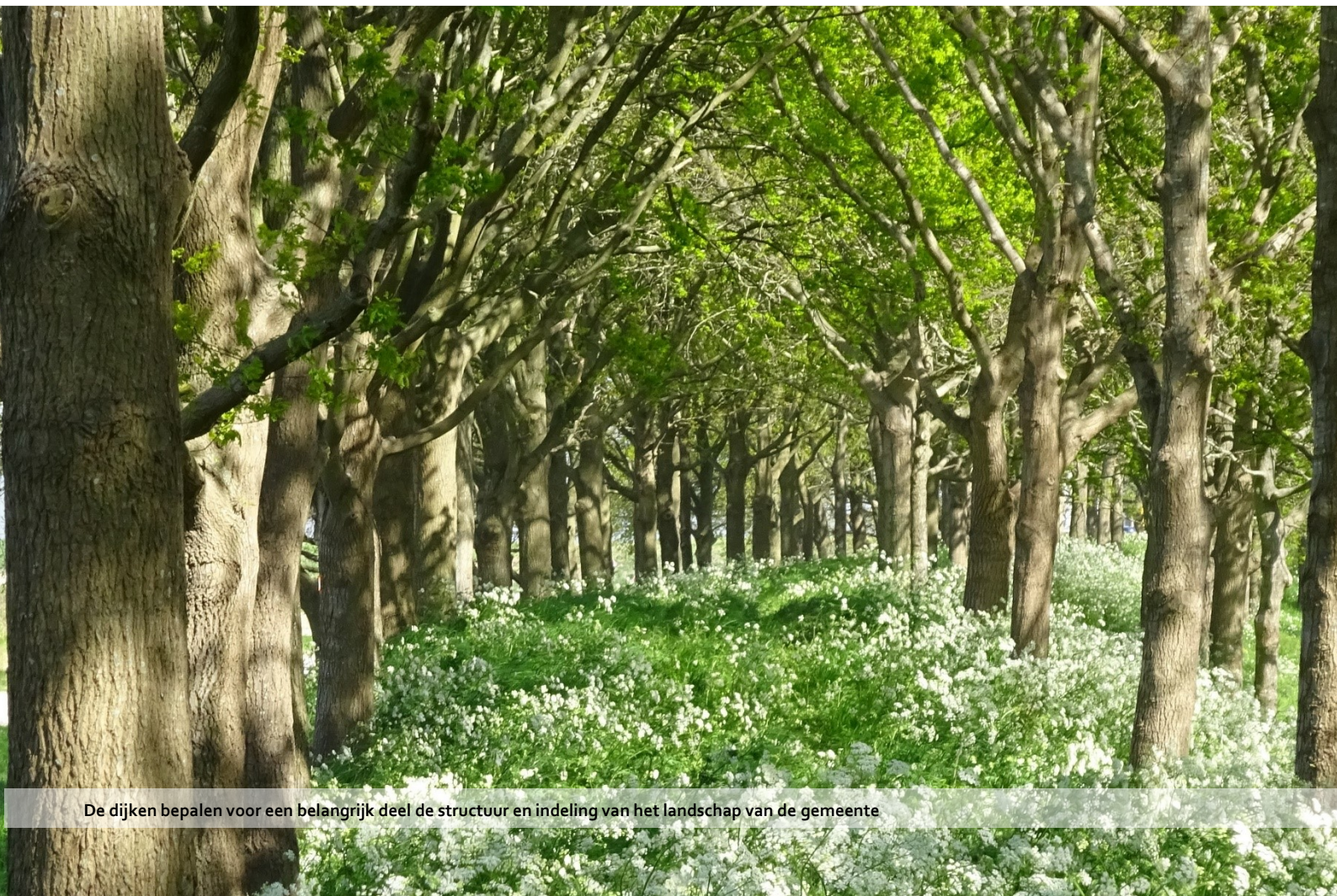
De dijken bepalen voor een belangrijk deel de structuur en indeling van het landschap van de gemeente