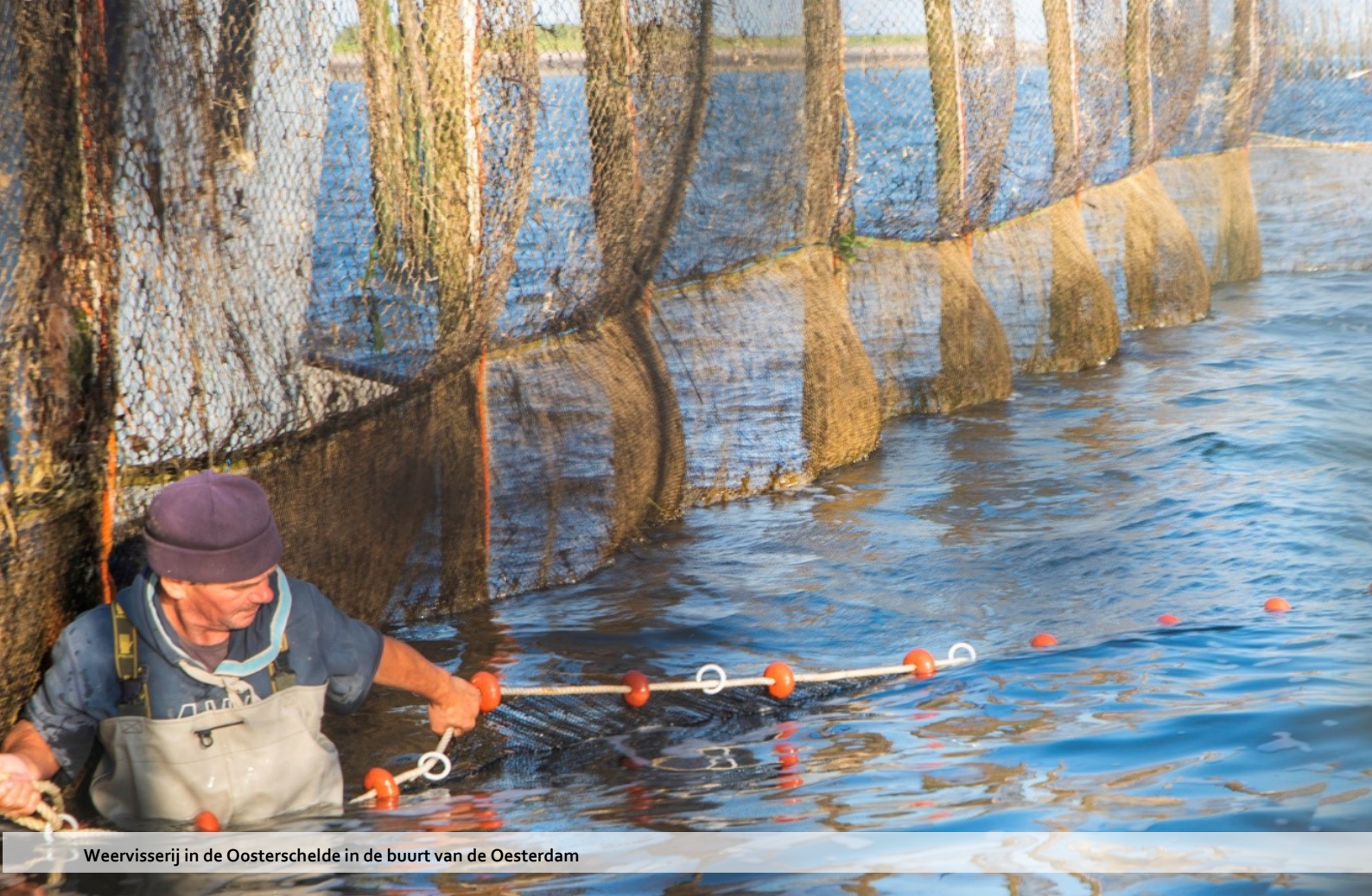
Weerwisserij in de Oosterschelde in de buurt van de Oesterdam