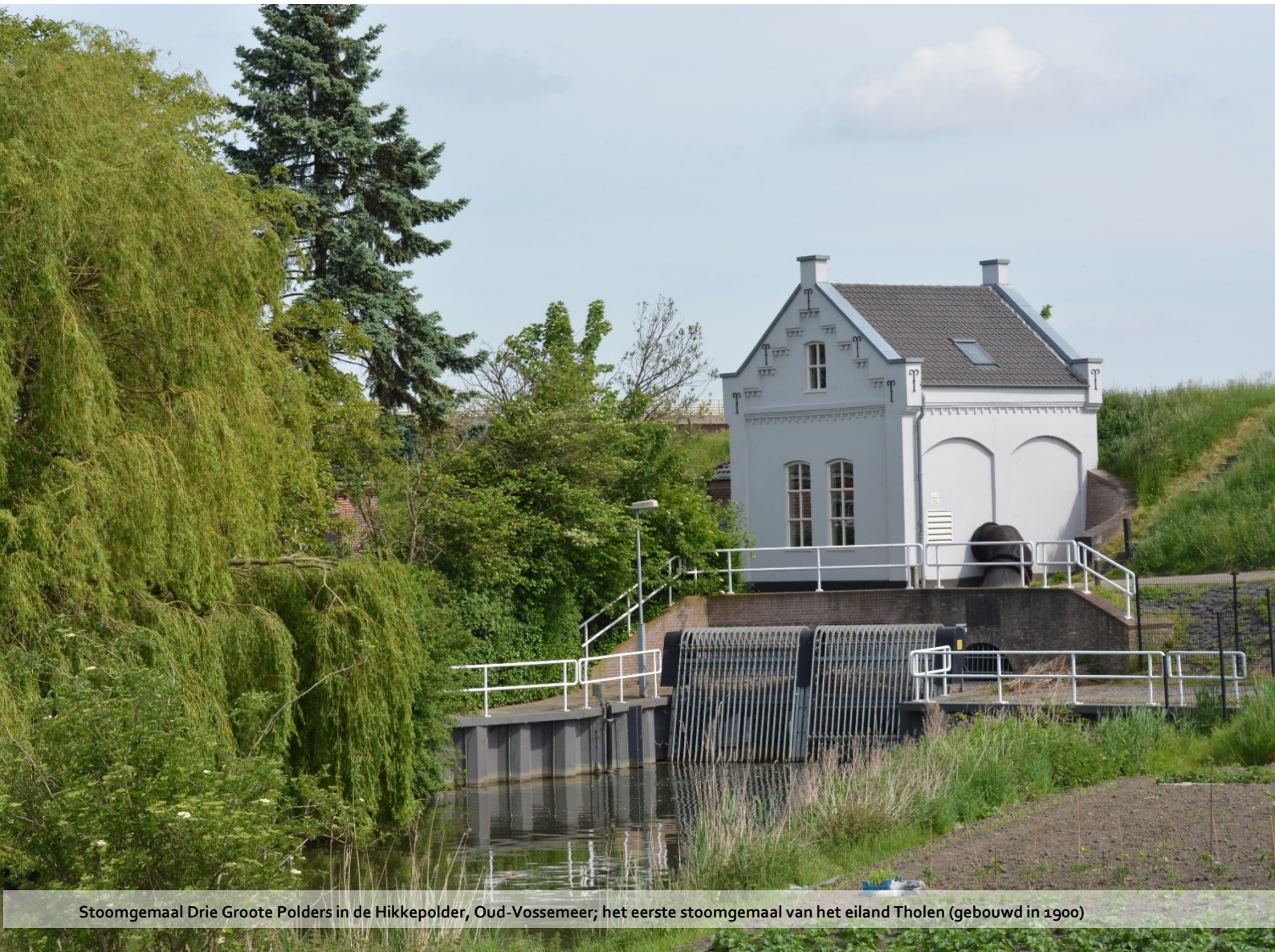
Stoomgemaal Drie Grote Polders in de Hikkepolder, Oud-Vossemeer; het eerste stoomgemaal van het eiland Tholen (gebouwd in 1900)