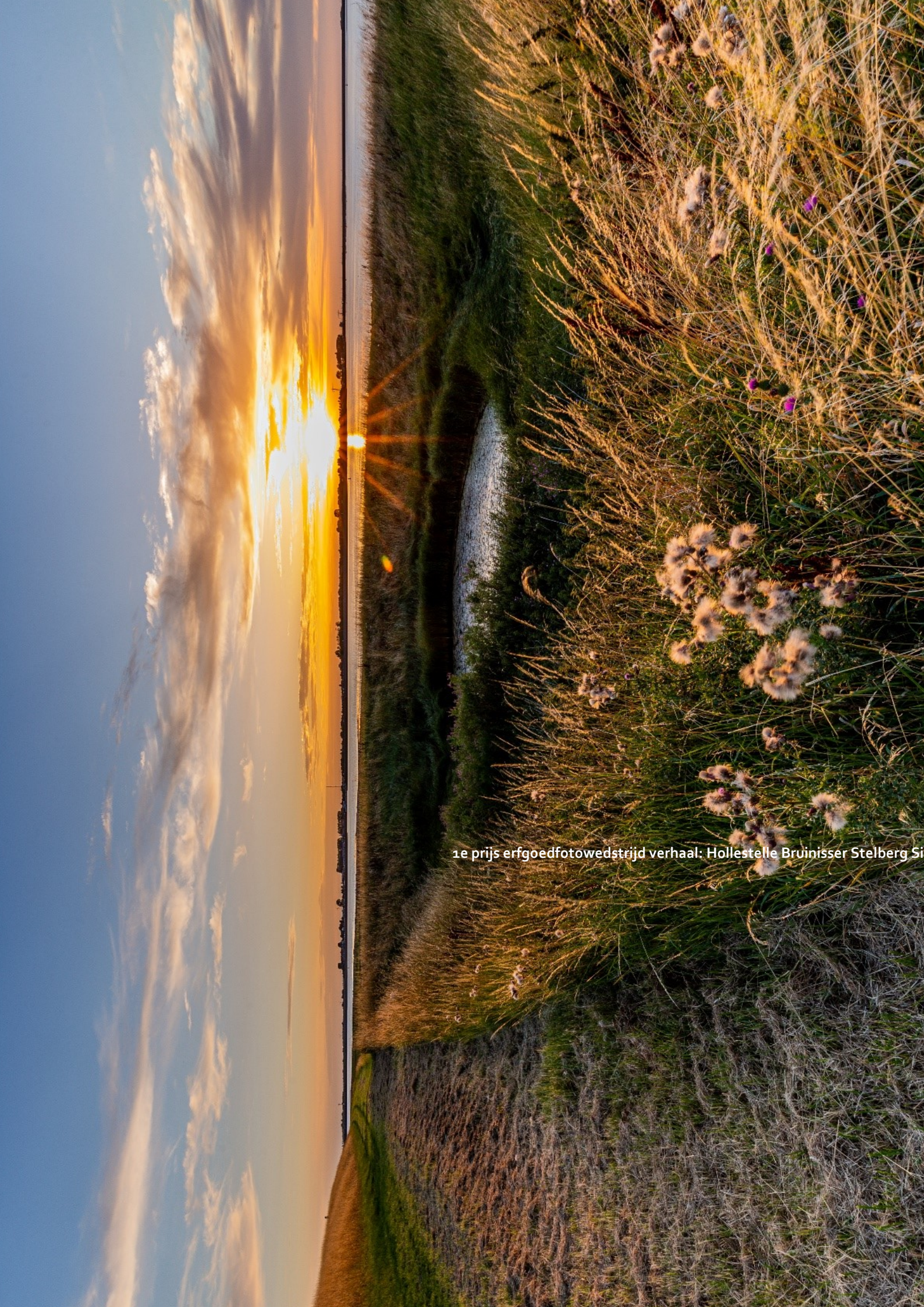
1e prijs erfgoedfotowedstrijd verhaal: Hollestelle Bruinisser Stelberg Si