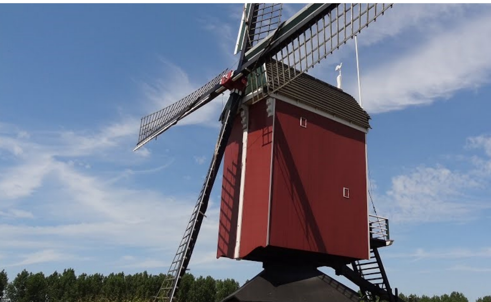
De Standerdmolen in Sint-Annaland werd gebouwd rond 1684. Dit is het oudste maalwerktuig van Tholen en de oudste nog bestaande molen van Zeeland.