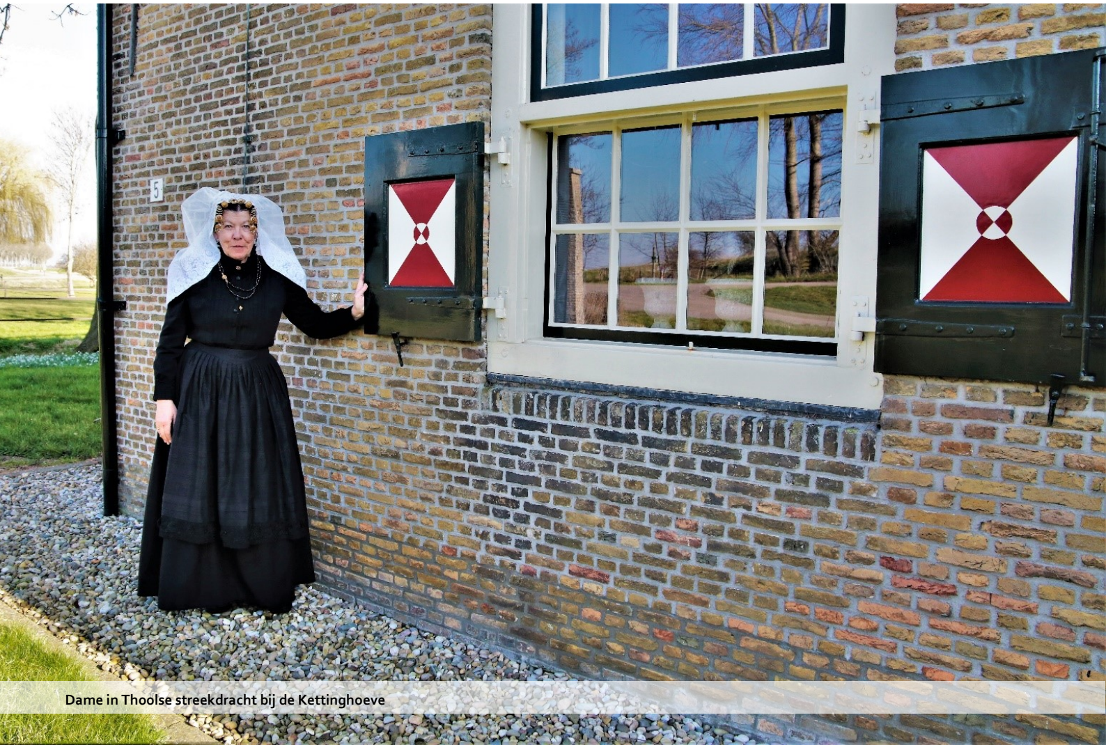
Dame in Thoolse streekdracht bij de Kettinghoeve