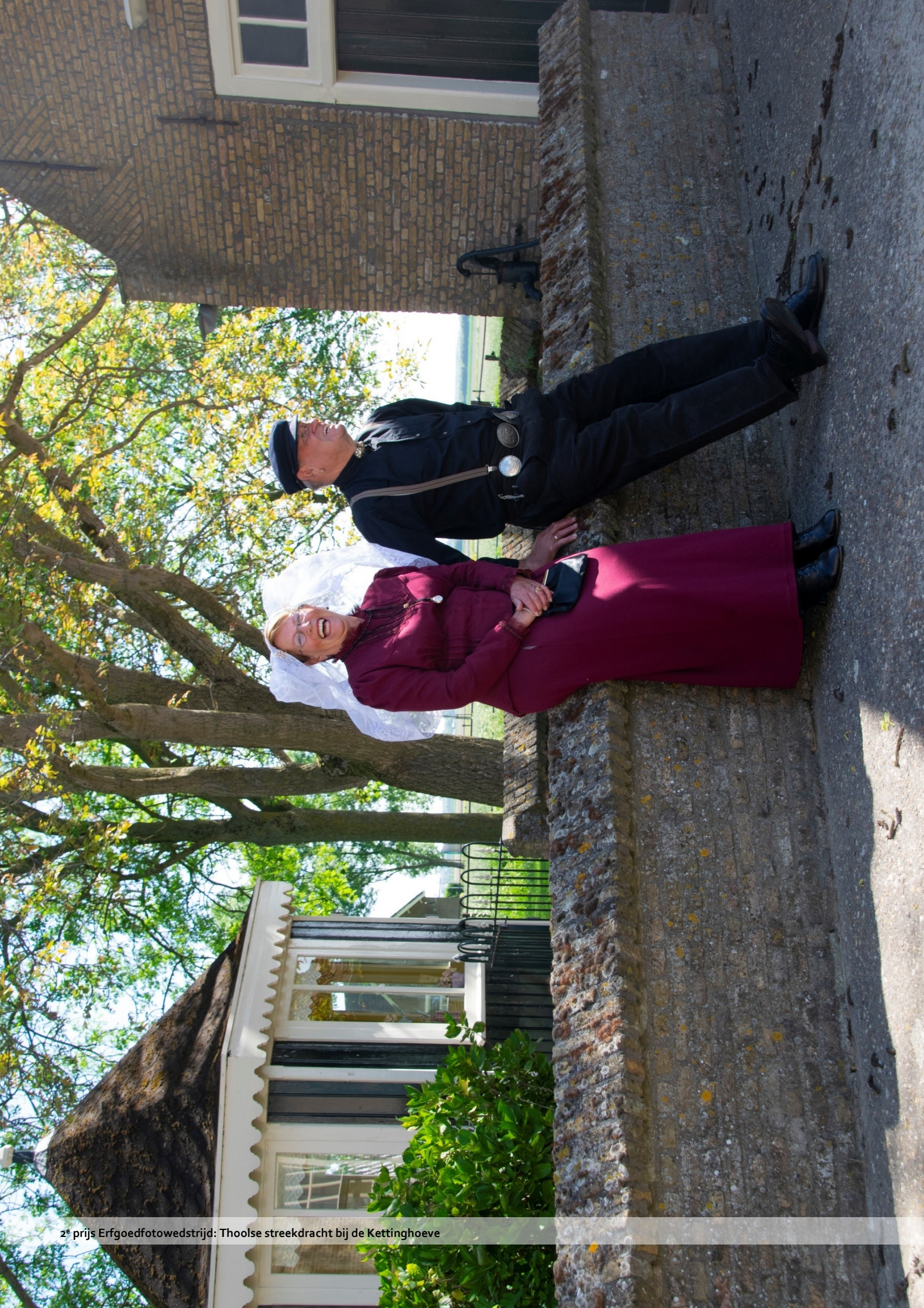
2 e prijs Erfgoedfotowedstrijd: Thooise streekdracht bij de Kettinghoeve