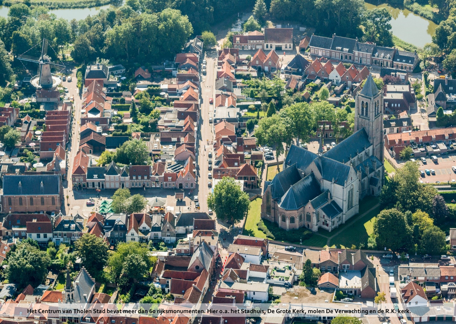
Het Centrum van Tholen Stad bevat meer dan 60 rijksmonumenten. Hier o.a. het Stadhuis, De Grote Kerk, molen De Verwachting en de R.K. kerk.