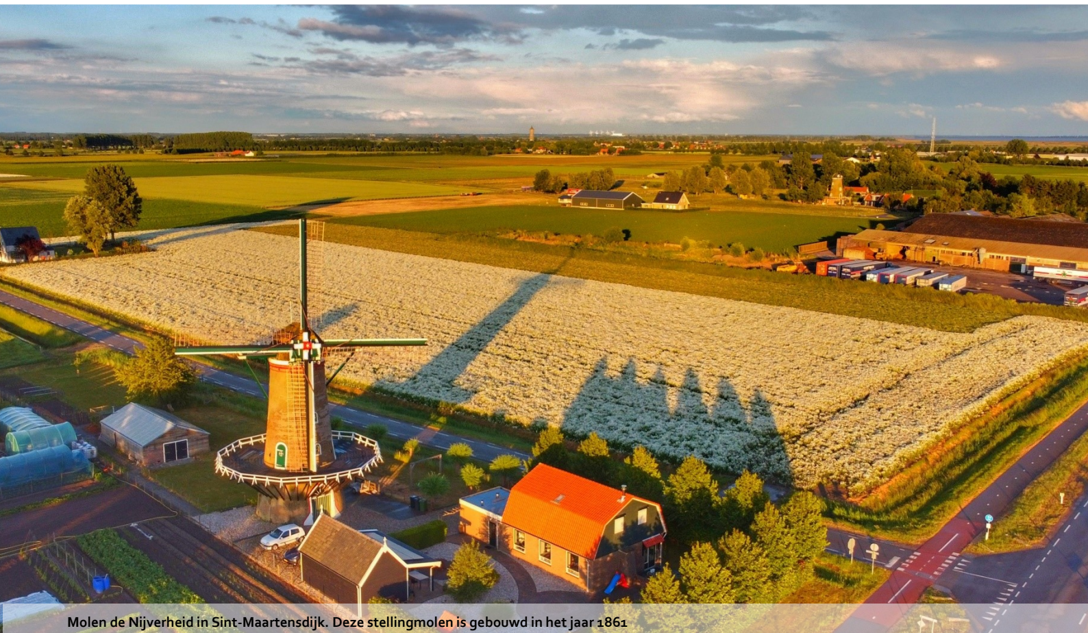
Molen de Nijverheid in Sint-Maartensdijk. Deze stellingmolen is gebouwd in het jaar 1861