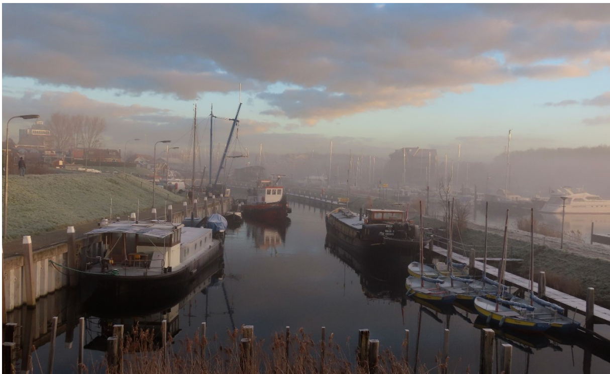
De haven van Tholen stad

Het volgende hoofdstuk bevat 'het verhaal van Tholen'. Dit verhaal gaat in vogelvlucht in op de rijke ontstaansgeschiedenis van Tholen; vanaf de late IJzertijd tot aan het heden. Hoofdstuk 3 gaat in op het waarom van een erfgoed visie. Hoofdstuk 4 'Het erfgoed van Tholen' beschrijft het erfgoed van Tholen per thema. Zo is er bijvoorbeeld voor gekozen om gebruiken, ambachten en verhalen te koppelen aan landschap en gebouwen. Er wordt op deze manier per thema een zo compleet mogelijk beeld van het Thoolse erfgoed geschetst, waarbij de samenhang tussen deze elementen behouden blijft. In hoofdstuk 5 worden de speerpunten van de gemeente voor de omgang met haar erfgoed toegelicht. Deze zijn toepasbaar op alle erfgoedthema's en vormen de randvoorwaarden voor een succesvol erfgoedbeleid. Aan deze speerpunten worden in hoofdstuk 6 acties gekoppeld die deze speerpunten verder uitwerken in concreet uitvoerbare projecten. Hoofdstuk 7 bevat het uitvoeringsplan ten behoeve van de implementatie.