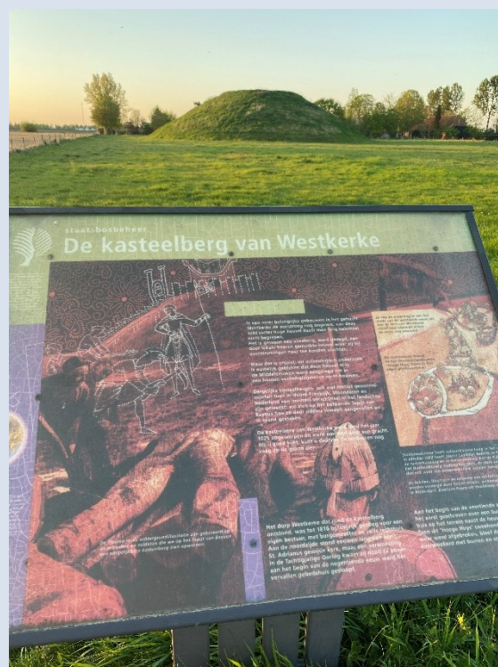
De kasteelberg van Westkerke in Scherpenisse

Binnen de gemeente Tholen zijn er twee rijksbeschermd stadsgezichten aangewezen, namelijk Tholen en Sint-Maartensdijk.