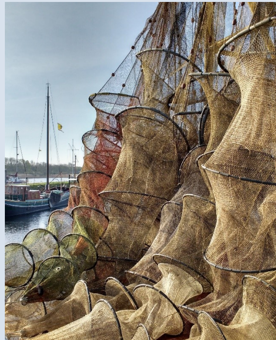
Visnetten in de haven van Tholen

Erfgoed is net zo divers als de beleidsterreinen waarmee het raakvlakken heeft. Dit houdt dan ook niet op bij toerisme en recreatie, maar breidt zich uit naar onder andere duurzaamheid, klimaatadaptatie, energietransitie, leefbaarheid, economie en wateropgaven. Naast het benutten en beleefbaar maken van erfgoed is het 'kenbaar' maken van erfgoed ook belangrijk. Door de kennis over het Thoolse erfgoed lokaal en regionaal te verspreiden wordt het benutten en beleven, en daarmee het behoud, van het Thoolse erfgoed eenvoudiger.