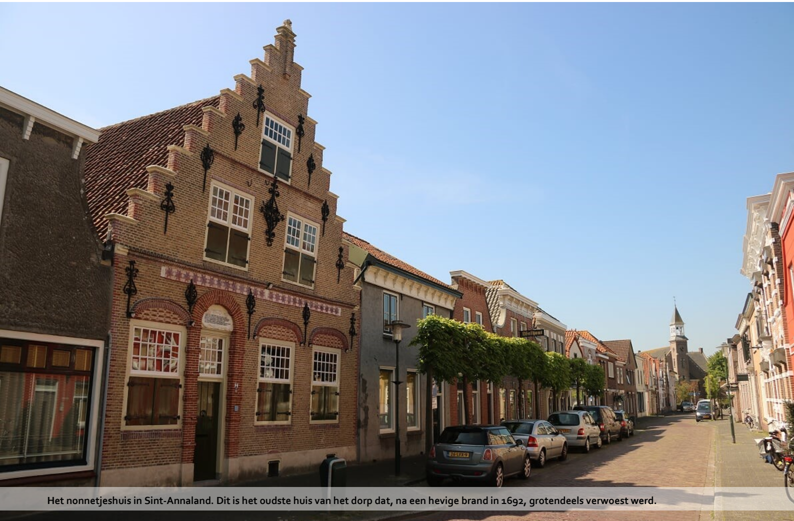
Het nonnetjeshuis in Sint-Annaland. Dit is het oudste huis van het dorp dat, na een hevige brand in 1692, grotendeels verwoest werd.