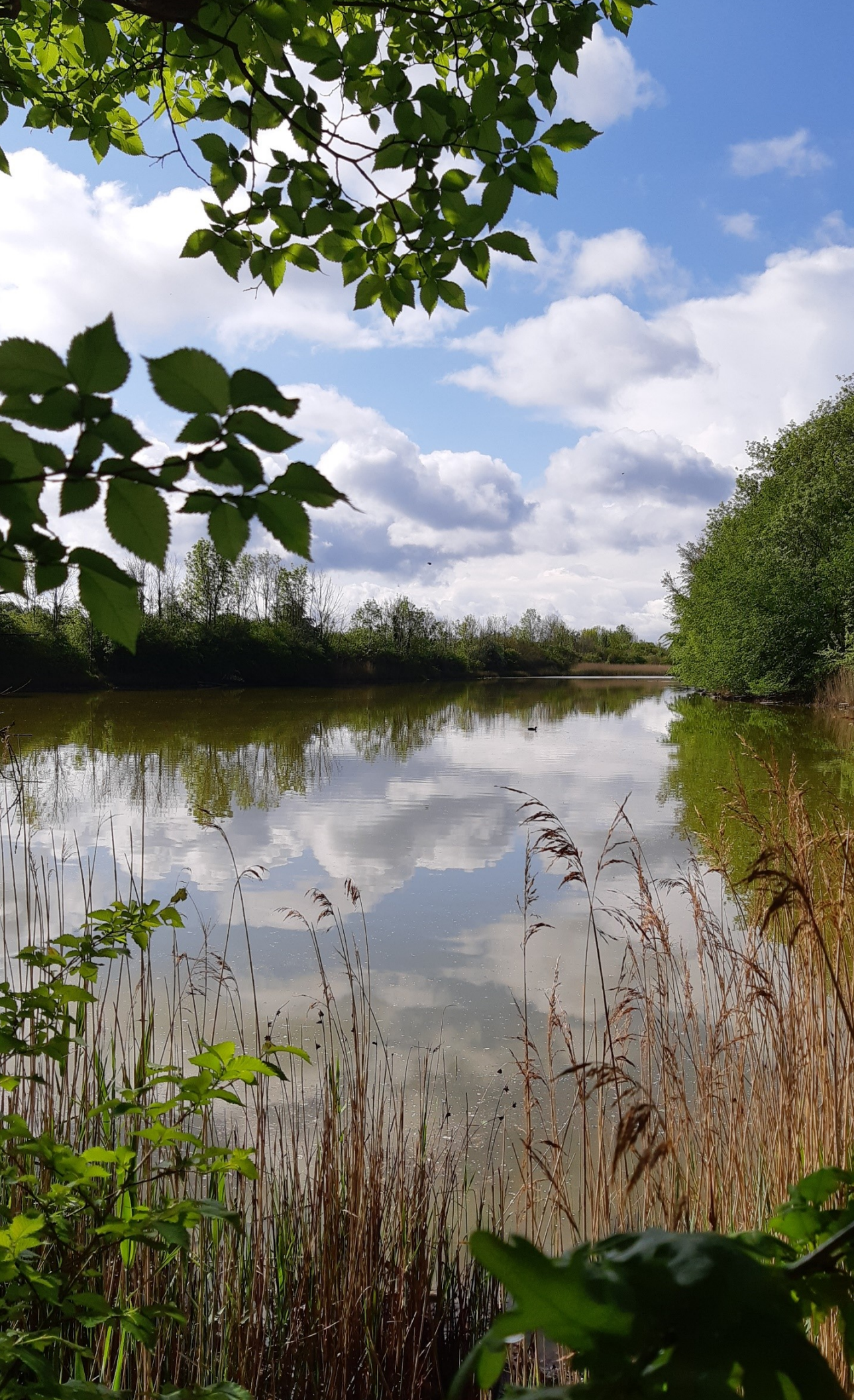
De Pluimpot bij Sint-Maartensdijk en karakteristieke elementen van andere kernen