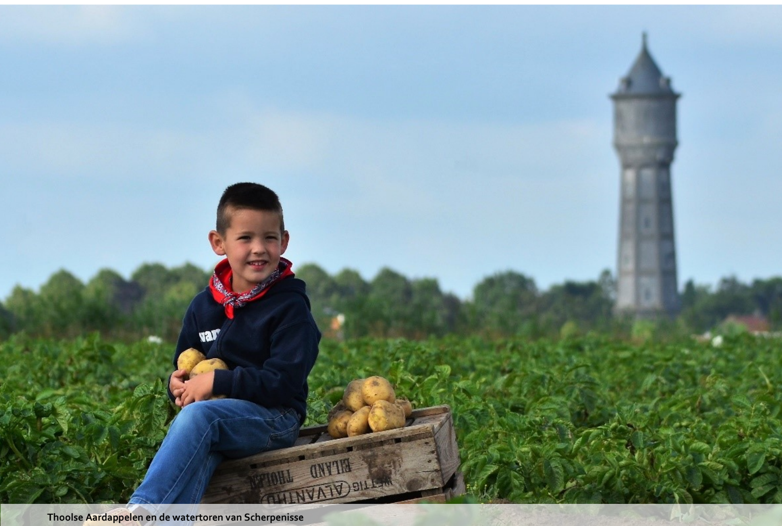
Thoolse Aardappelen en de watertoren van Scherpenisse